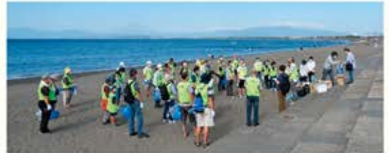
▲ 片瀬西浜海岸清掃ボランティア