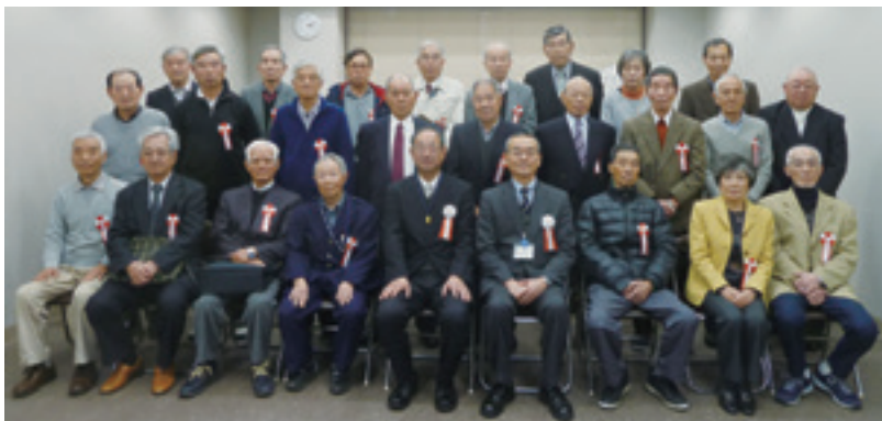
これからもお元気で、益々のご活躍を!!

が豊かな高齢期を過ごす秘訣でもあります。藤沢市は健康寿命日本一を目指しており、また、国も高齢者や障がい者等が支え合う地域共生社会を目指しています。市はこの環境づくりを果たしてまいりますので、今日受賞された皆様方、これからも健康に留意され、益々のご活躍を心より祈念申し上げます」との挨拶がありました。