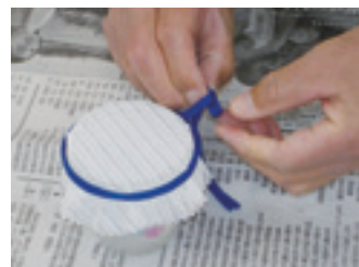
リボン巻いて芳香剤のできあがり!

職員の指導に従って、ガラス容器に保冷剤の中身を半分ほど取り出して入れ、そこにアロマオイルのラベンダー、オレンジスイート、ゼラニウムなどの芳香剤を順次入れてかき混ぜる。この香りの付いた、ドロドロした保冷剤の中に、貝殻やビーズなど彩りとなる物を入れ、これに水を少量加え、最後